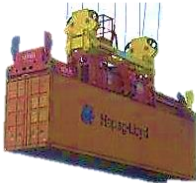
Fig. 2 – Single lift