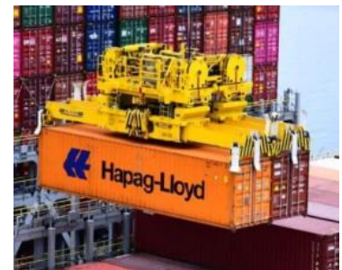
Fig. 4 – Tandem lift