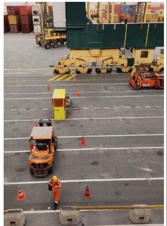
Fig. 3 – Opstelling van de veilige zone, incl. binbak, schuilhokje en heftruck