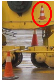
Fig. 2 – Kegelsticker op kraanpoot